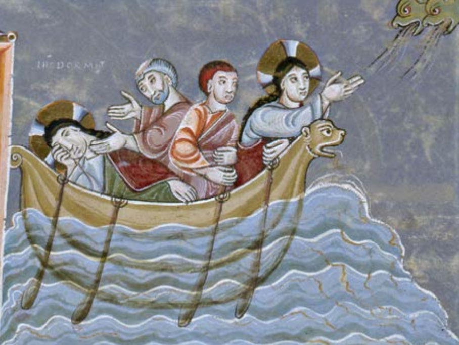
Évangélaire d'Echternach, Tempête sur le lac, Musée national germanique de Nuremberg