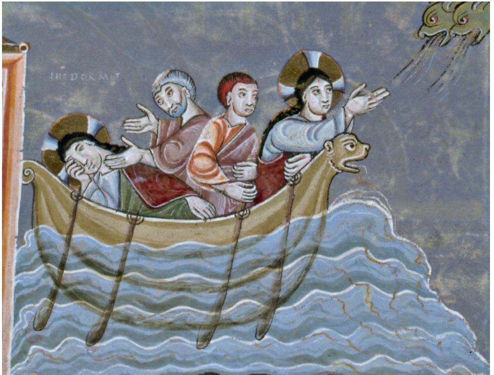
Évangélaire d'Echternach, Tempête sur le lac, Musée national germanique de Nuremberg