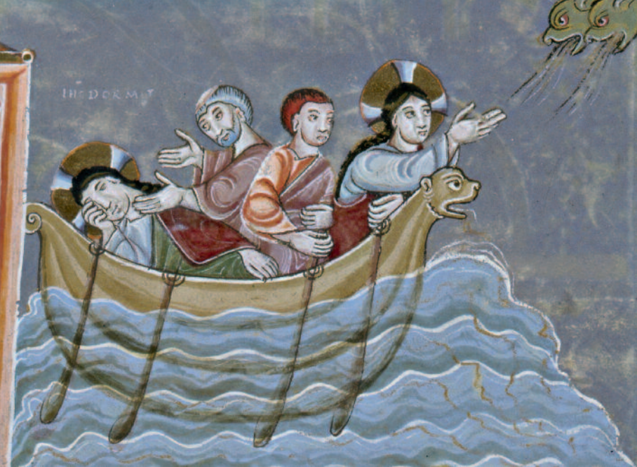
Ewangeliarz z Echternach, Uciszenie burzy na jeziorze, Germańskie Muzeum Narodowe w Norymberdze