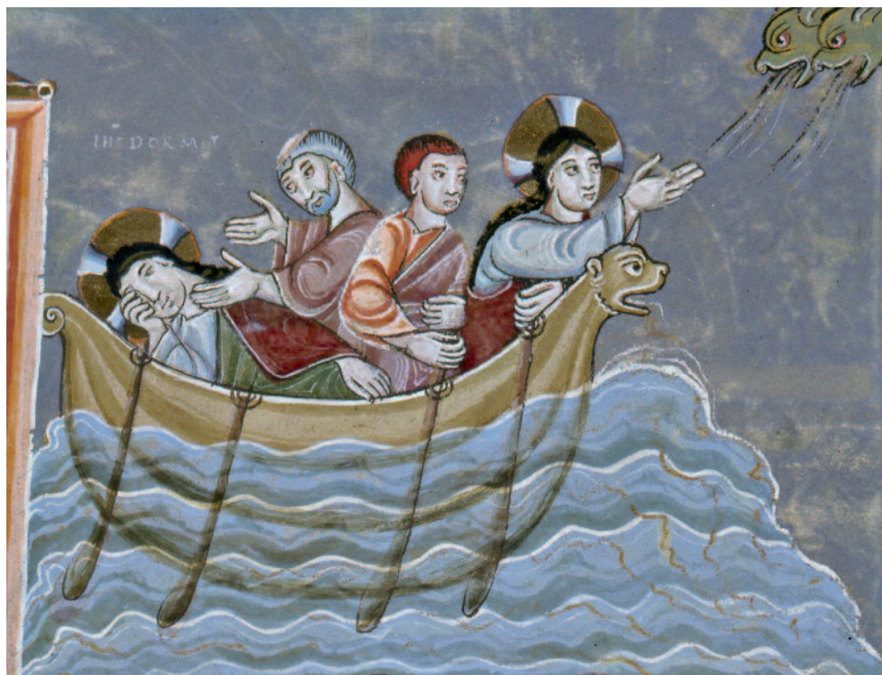
Ewangeliarz z Echternach, Uciszenie burzy na jeziorze, Germańskie Muzeum Narodowe w Norymberdze